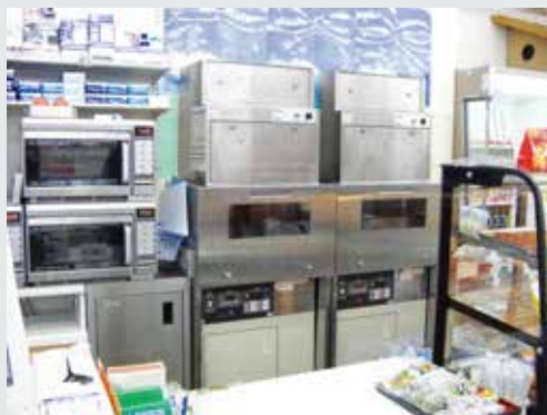
コンビニカウンター内小型フライヤー用脱臭システム