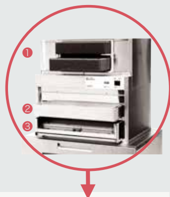
① 脱臭フィルター(2枚)